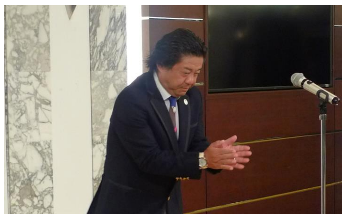
富坂会員 中締め挨拶