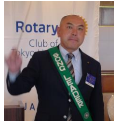
ソングリーダー三輪会員