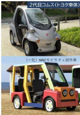
超小型モビリティの例