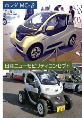
普通自動車以下の車両規格一覧