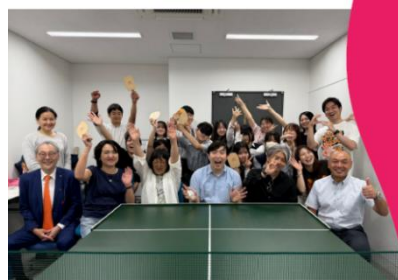
昨年度最終例会（宝仙学園・STI）の様子